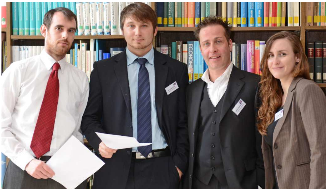
Team Stegmann Personaldienstleistung GmbH