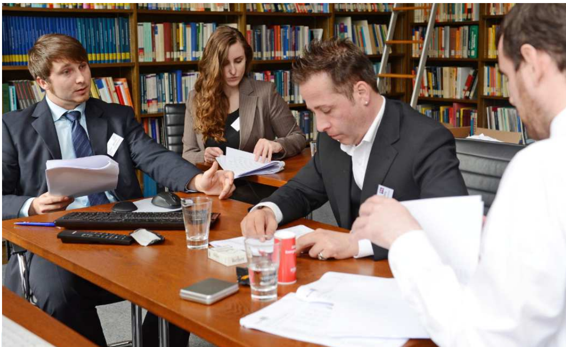
Unsere Entscheidungen in den Live-Finalrunden vor Ort trafen wir in der Bibliothek des Schlosses.

Sobald es uns von den Umsatzzahlen her möglich war, haben wir verschiedene Szenarien getestet und aus den Ergebnissen gelernt. Das bereicherte unser Wissen immens und wir konnten die betrieblichen Prozesse noch besser einschätzen und steuern. Dieses zusätzlich gewonnene Wissen half uns natürlich im Finale, da wir letztendlich von einem größeren Erfahrungsschatz profitieren konnten als unsere Konkurrenz.